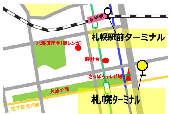
札幌駅周辺のりば

潮まつり期間は交通規制に伴う迂回運行により、「稲穂3丁目」、「色内1丁目」、「小樽芸術村」を通過しない便がございます。